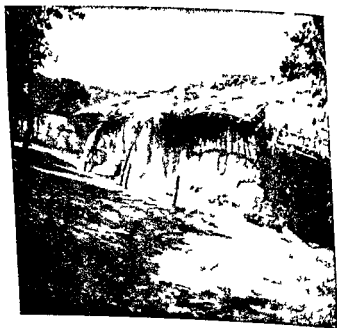
पुराना रूप—फूस की भोपडियाँ

में वच्चो की शारीरिक सफाई पर भी ध्यान रखा जाना । उनके नाखून कटे है कि नहीं, कपडे मे से गव तो नहीं रही है, वालो की सफाई की है कि नहीं, स्नान किया कि